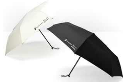
스탬프 투어 물품(우산)